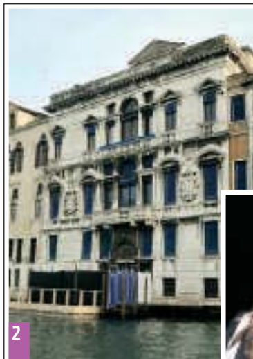
1 L'artista Damien Hirst. 2 Palazzo Mocenigo. 3 Angelina Jolie e Brad Pitt in giro per Venezia.